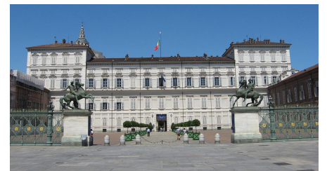
Palais Royal / https://www.ilpalazzorealeditorino.it