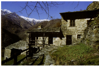
collège des Barbes